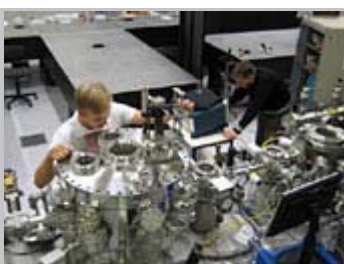
Arbeit im Max-Planck-Institut für Quantenoptik