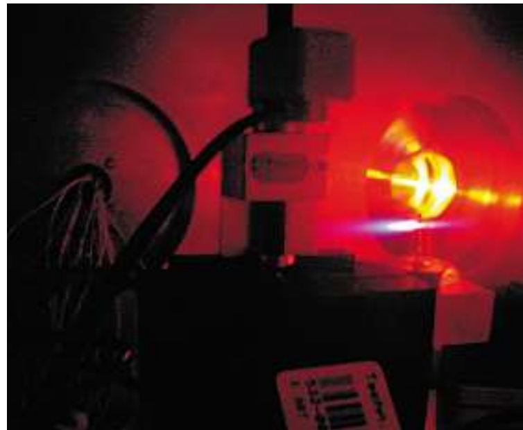
Das violette Licht entsteht durch Heliumatome, angeregt durch Laserlicht. Den gleichen Weg nimmt der nicht sichtbare, auf wenige 100 Mikrometer gebündelte Röntgenstrahl.

eine elektrische Ladung schwingt, strahlt das System Atomkern-Elektron wie eine Antenne Wellen ab. Und weil eine Welle im Takt des Rotlichtlasers auf die nächste folgt, strahlen auch alle daraus entstehenden Wel-