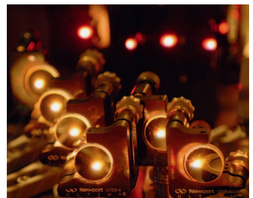
Eine Vielschichtspiegel-Anordnung komprimiert Breitband-Laserpulse auf 1,5 Schwingungszyklen